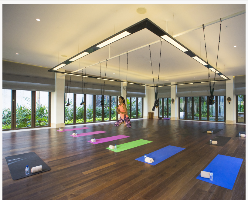
Yoga Studio im Das Ritz-Carlton, Bali

Prhativi Dyah The Ritz-Carlton, Bali +(62)361 849 8988 email us here