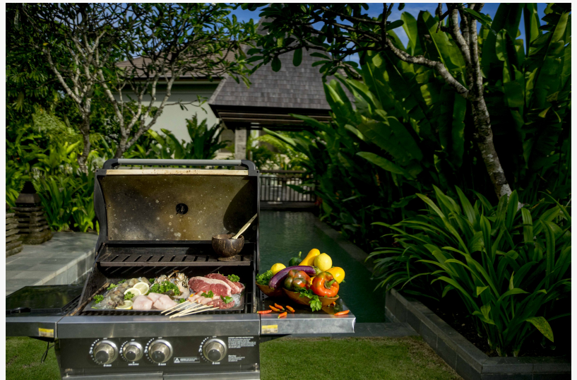
Intimer Grillplatz mit privatem Pool