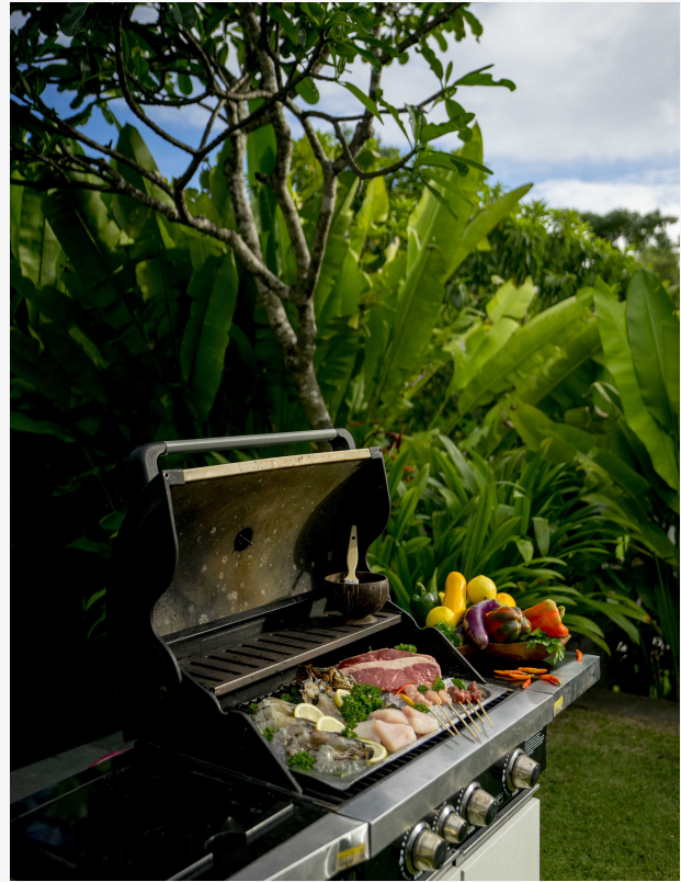
In der Villa BBQ-Anzeige in der Villa

Prhativi Dyah The Ritz-Carlton, Bali +(62)361 849 8988 email us here