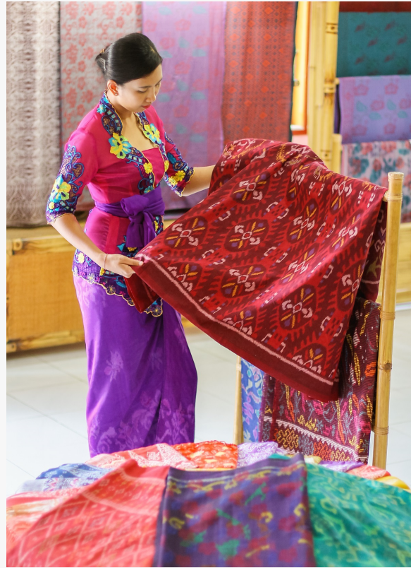
Sarongs spiegeln die historischen Traditionen Balis wider

In elegant tropischem Ambiente begrüßt das The Ritz-Carlton, Bali mit atemberaubender Kulisse der Felsklippen und des weißen Sandstrandes seine Gäste. Ob Familien- oder Businessaufenthalt, der beruhigende Blick auf das azurblaue Wasser des indischen Ozeans lässt alle Gäste des Resorts in den 279 geräumig und üppig gestalteten Suiten und 34 Villen in luxuriösem zeitgenössischen balinesischen Ambiente entspannen. Entlang des Meeresufers liegt der The Ritz-Carlton Club®, sowie sechs moderne Speiselokale, ein exotisch und maritim inspirierter Wellnessbereich und viel Spiel und Spaß im Ritz Kids Club für Kinder jeden Alters. Die direkt am Strand gelegene glamouröse Kapelle ist der perfekte Ort für wunderschöne Eheschließung und eine große Gartenanlage bietet Platz für private Feierlichkeiten und Hochzeiten auf Bali. Voll ausgestattete Konferenzräumlichkeiten, luxuriöse Tagungs-Venues und individuelle Pauschalangebote, von unseren erfahrenen Event-Planern zusammengestellt, die gerne für Sie auch MICE für die Tourismus Branche auf Bali organisieren. Sei es eine Konferenz, Urlaub oder Flitterwochen, das The Ritz-Carlton, Bali ist der perfekte Ort, um Ihren Aufenthalt unvergesslich zu machen. Folgen Sie uns auf Facebook, Instagram, Twitter, YouTube und LinkedIn.