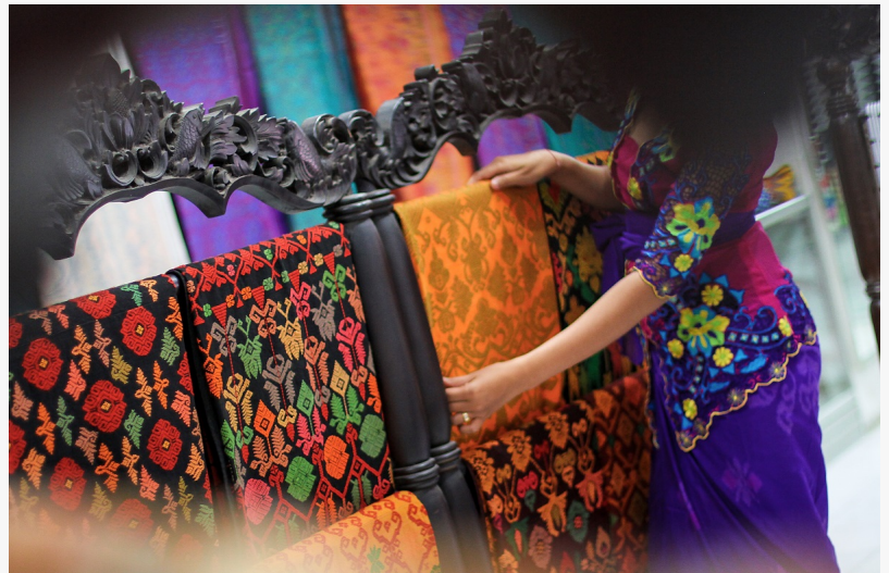
Sarongs werden für viele verschiedene Arten von Anlässen, einschließlich religiöser Zeremonien, getragen