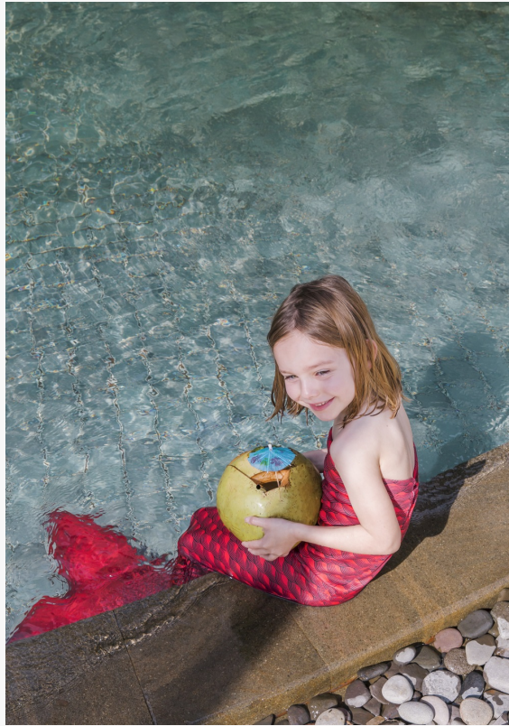
Das Ritz Kids Aquatic Goddess-Programm fördert den kreativen Geist eines Kindes