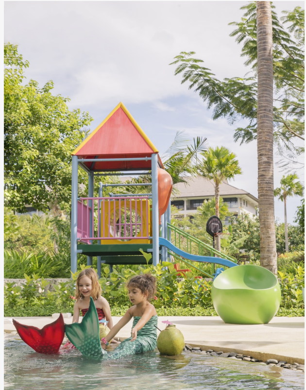
Ein unterhaltsames Erlebnis im Ritz Kids Pool