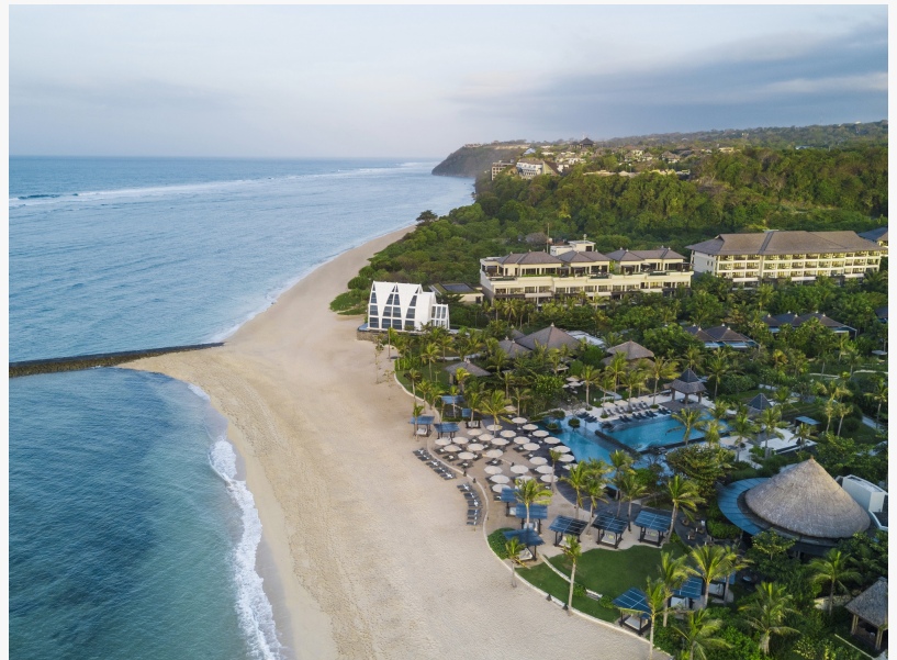
Das beste Familienresort in Bali

This press release can be viewed online at: http://www.einpresswire.com