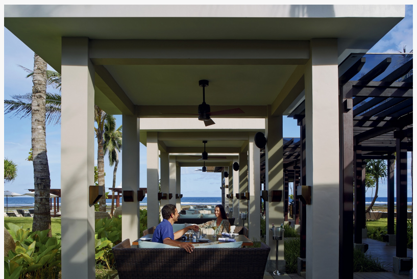
Пасхальный воскресный бранч у Индийского океана

идеальным местом как для романтического путешествия, так и для семейных каникул или