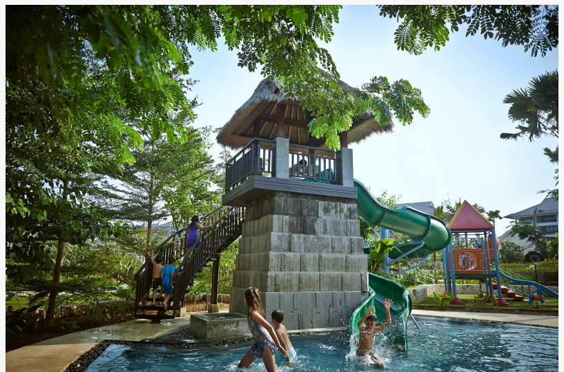
Ritz Kids выделенный детский бассейн