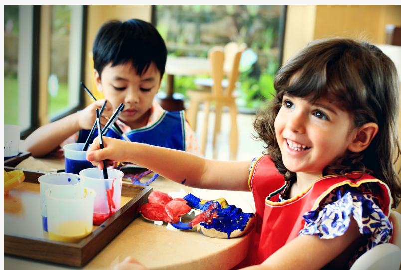
Маска Живопись для Детей

вашем распоряжении большие семейные люксы, пляжные развлечения и культурные экскурсии, от которых можно получить удовольствие всей семье. Дети будут в восторге от веселой и творческой программы в специальном детском клубе курорта: Ritz Kids , пока