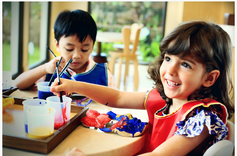
Maskenmalerei für Kinder

Exkursionen, die für Familien geeignet sind, freuen sich Kinder auf das unterhaltsame und kreative Programm im Ritz-Kids , dem Kinderclub des Resorts. In der Zwischenzeit können Eltern den festlichen Geist des Osterfestes mit einer Auswahl an kulinarischen Angeboten – unter