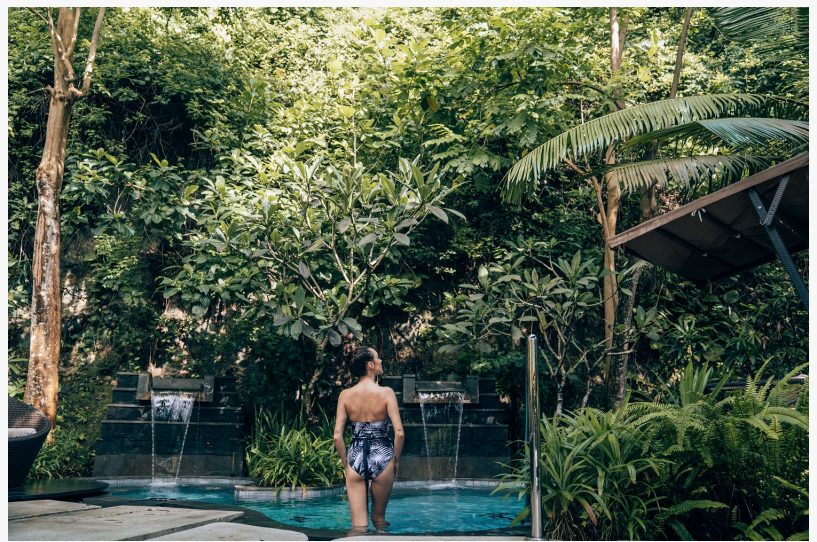
Verwöhnen Sie sich im balinesischen Badebecken

Über das The Ritz-Carlton, Bali. In elegant tropischem Ambiente begrüßt das The Ritz-Carlton, Bali mit atemberaubender Kulisse der Felsklippen und des weißen Sandstrandes seine Gäste. Ob Familien- oder Businessaufenthalt, der beruhigende Blick auf das azurblaue Wasser des indischen Ozeans lässt alle Gäste des Resorts in den 278 geräumig und üppig gestalteten Suiten und 34 besten villen im Bali in luxuriösem zeitgenössischen balinesischen Ambiente entspannen. Entlang des Meeresufers liegt der The Ritz-Carlton Club®, sowie sechs moderne Speiselokale, ein exotisch und maritim inspirierter Wellnessbereich und viel Spiel und Spaß im Ritz Kids Club für Kinder jeden Alters. Die direkt am Strand gelegene glamouröse Kapelle ist der perfekte Ort für wunderschöne Hochzeiten und eine große Gartenanlage bietet Platz für private Feierlichkeiten und Firmenveranstaltungen. Voll ausgestattete Konferenzräumlichkeiten und individuell