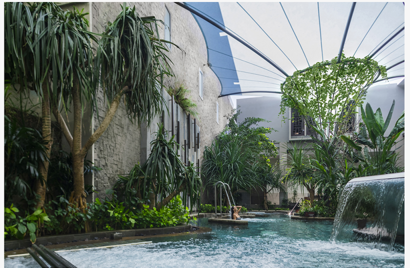
Hydro Vital Pool