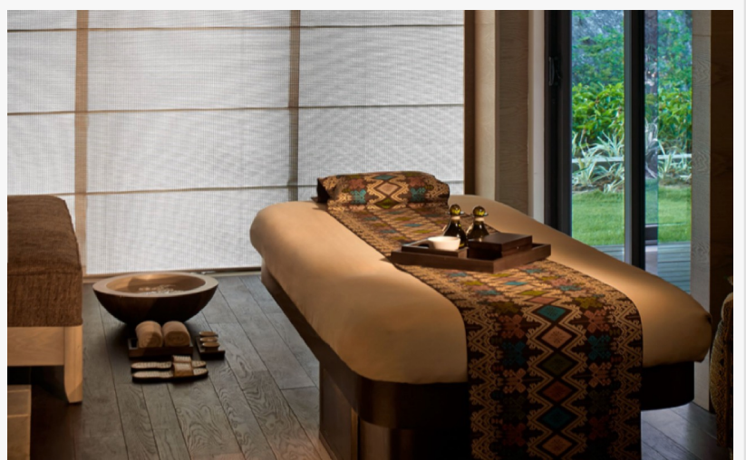
Behandlungsraum im The Ritz-Carlton, Spa

Prhativi Dyah The Ritz-Carlton, Bali +62361 848988 email us here Visit us on social media: Facebook Twitter Google+ LinkedIn