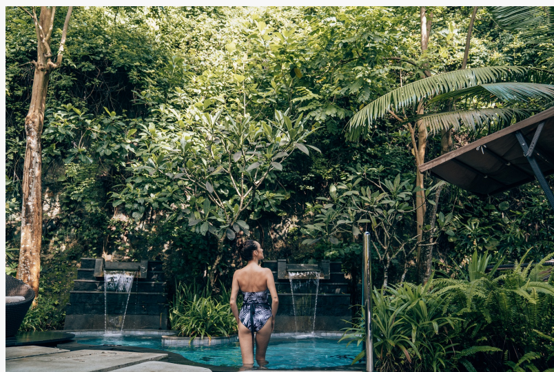
Indulge in Balinese Pool

раскинувшегося вдоль побережья Индийского океана на южной оконечности острова – в сочетании белоснежного песка на берегу океана и возвышающегося утеса, на котором он находится. Захватывающие виды на голубую лагуну и 279 изысканно обставленных