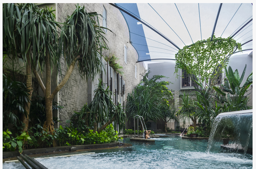
Бассейн «Гидро Витал»

DENPASAR, BALI, INDONESIA, April 7, 2019 /EINPresswire.com/ -- Удивительное дизайнерское сооружение - Бассейн «Гидро Витал» в отеле The Ritz-Carlton, Bali окружен пышной растительностью и берет свое название от греческого слова «вода» и латинского слова «жизнь», обеспечивая уникальный и приятный опыт лечения водой. Лечебные сеансы в бассейне теперь доступны: на 30 минут за IDR 288 000 ++, 60 минут за IDR 388 000 ++ и 90 минут за IDR 488 000 ++.