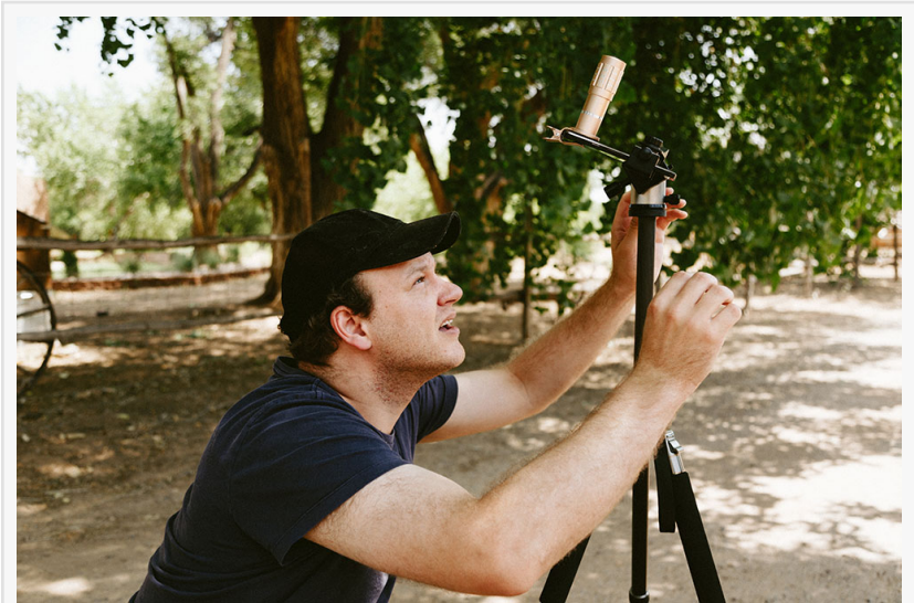
Hombre fotografiando Eclipse con el teléfono de venta

Cualquier persona que planea ver el eclipse solar debe comprar gafas certificadas para eclipse solar o visores portátiles. Para aquellos que observan el eclipse fuera del camino de la totalidad, las gafas se deben usar en todo momento, mientras que las personas que observan el eclipse total se pueden quitar las gafas durante la fase de la totalidad, pero deben mantenerlas puestas antes y después.