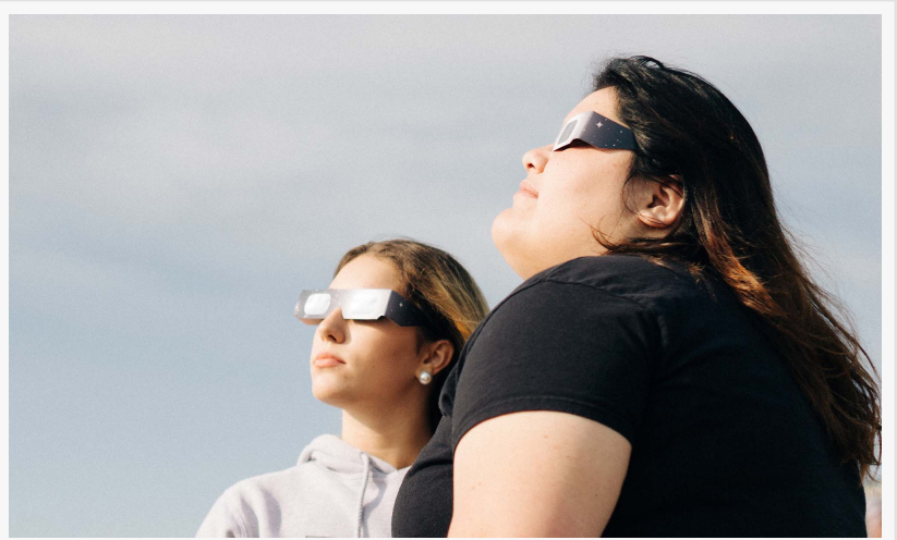
Dos mujeres viendo el Eclipse solar

Tommy Hintz Educacion Eclipse +54 9 11 5747-9694 email us here