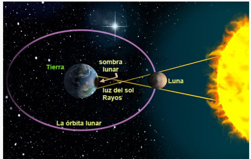
Diagrama de la tierra y la luna del Eclipse solar

This press release can be viewed online at: http://www.einpresswire.com