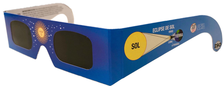
Anteojos Para Ver El Eclipse Solar Argentina 2019 Sol Lentes