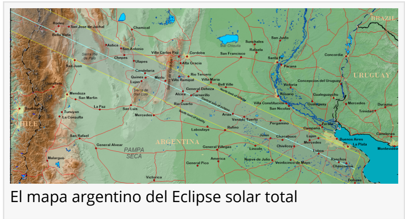
El mapa argentino del Eclipse solar total

Unas pocas horas antes de la puesta del sol, la Luna bloqueará el Sol y cambiará el día a un crepúsculo misterioso. Durante la totalidad, es seguro mirar al Sol sin protección para los ojos. Sin embargo, la NASA dijo que la única forma de observar de manera segura el Sol parcialmente eclipsado o no es a través de filtros solares especiales, que vienen en lentes de eclipse o visores de mano.