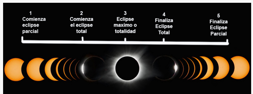
fases del Eclipse solar total

Sobre tierra, la totalidad se observará primero en América del Sur, cerca de la ciudad de La Serena en la costa de Chile, a las 4:39 p.m. hora local, el 2 de julio. Después de cruzar los Andes, la sombra de la Luna rozará San Juan, la ciudad de Argentina. A medida que la sombra avanza hacia el este a través de la tierra, se deslizará hacia el sur de Buenos Aires y Córdoba y regresará al Océano Atlántico poco antes del atardecer, a las 5:40 p.m. hora local.