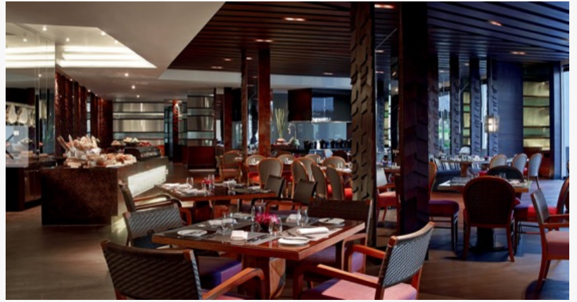
Ресторан Senses Breakfast

This press release can be viewed online at: http://www.einpresswire.com