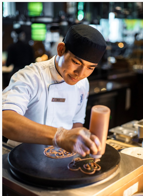
Созданный блин, обеспеченный каждый день, чтобы соблазнить вкусы детей

«Являясь отмеченным наградами семейным курортом, мы постоянно стремимся создавать новые впечатления у наших маленьких гостей. Это выражается в нашей фирменной программе клуба Ritz Kids , в широком спектре семейных мероприятий и, конечно же, в