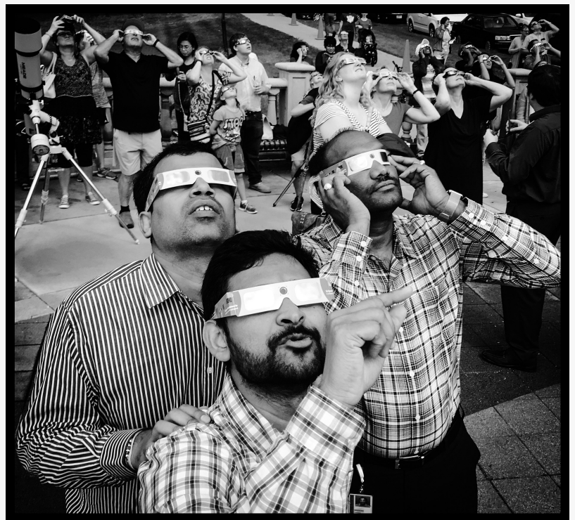
Los hombres que miran la imagen total solar eclipse