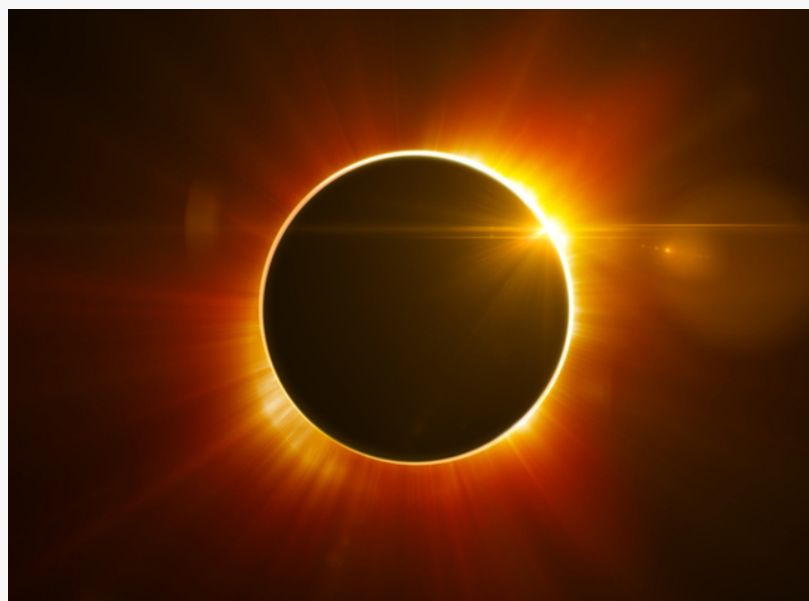
Eclipse total del Sol July 2, 2019