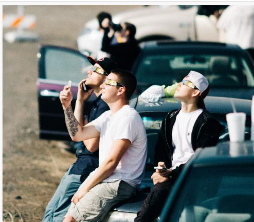
Los hombres ven con seguridad el eclipse solar