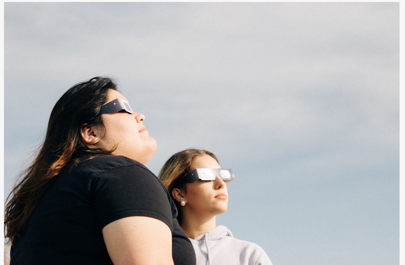
Mujeres viendo con seguridad el eclipse solar