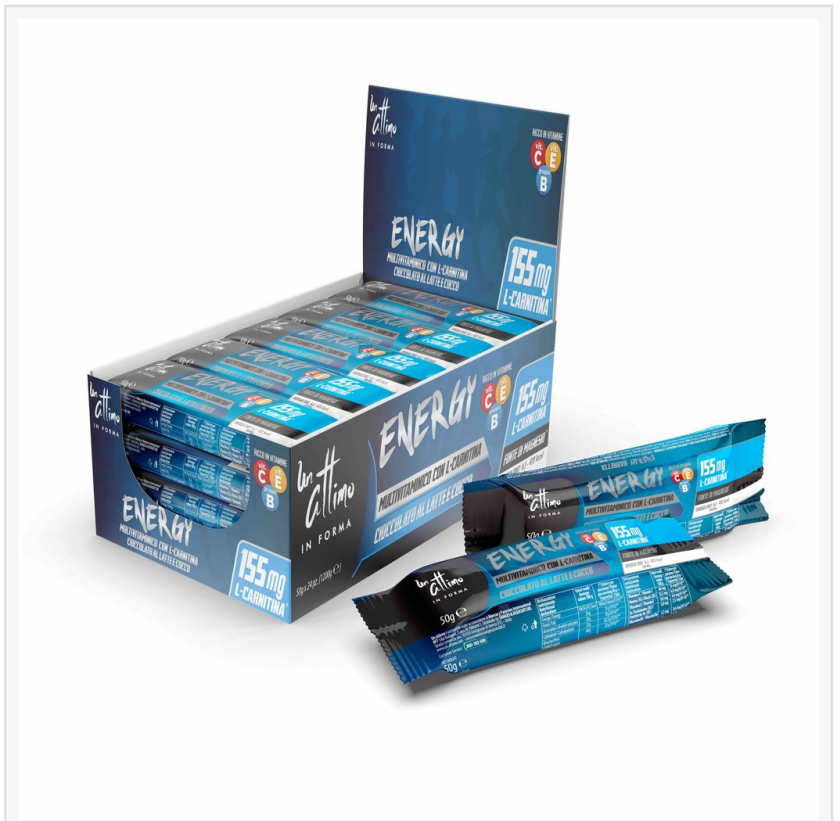
Barrette Un Attimo In Forma Box 24 pezzi