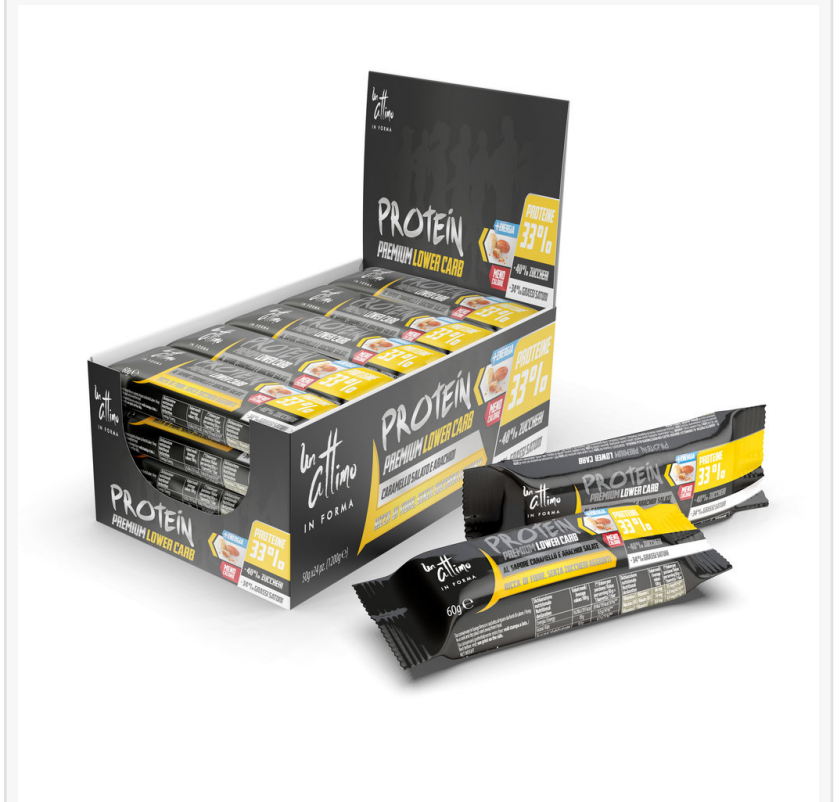
Barrette Un Attimo In Forma Protein 33% - Box 24 pezzi