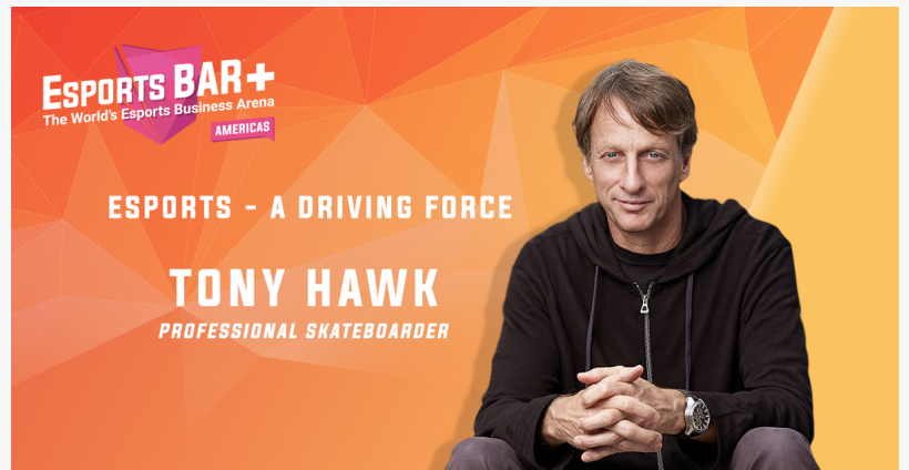
Tony Hawk Fireside Chat at Esports BAR+ Americas