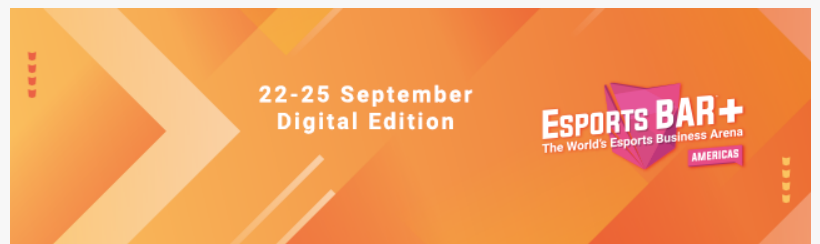
Esports BAR+ Americas