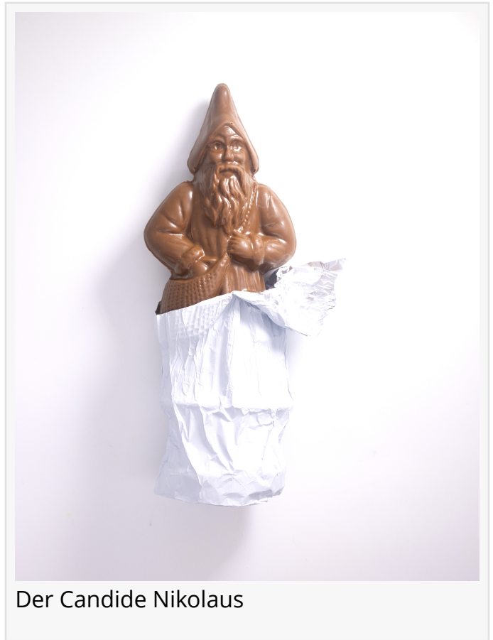
Der Candide Nikolaus