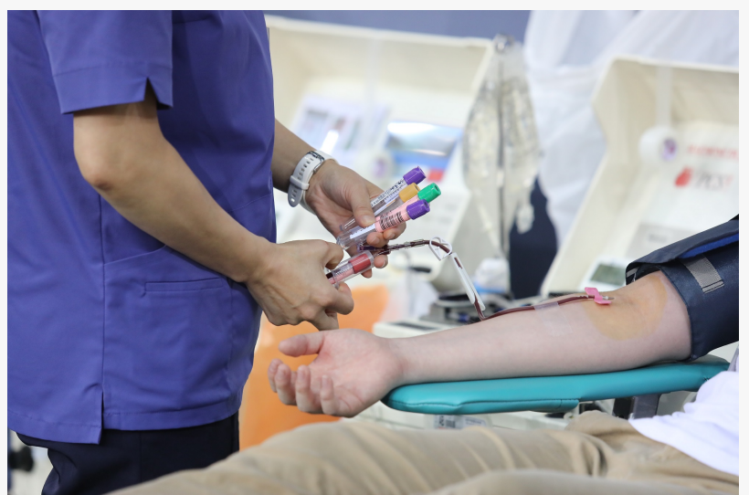
Membrii Bisericii Shincheonji doneaza plasmă la Centrul de Promovare

□ Shincheonji Biserica lui Isus a condus deja două grupuri de donări de plasmă în iulie și septembrie. Un total de 2.030 de persoane au participat la donarea de plasmă până în prezent în scopul dezvoltării tratamentului cu plasmă, iar aproximativ 1.700 dintre ei sunt membri ai Shincheonji Biserica lui Isus. Sunt 312 de persoane care au participat cel puțin de două ori.