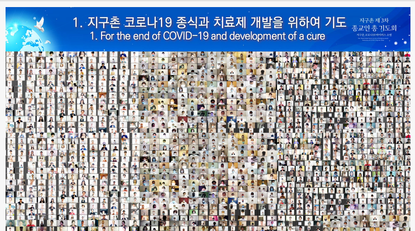
Shincheonji Biserica lui Isus a găzduit un eveniment de rugăciune online

Având loc înaintea donării de plasmă a unui grup format din 4.000 de membrii Shincheonji, care s-au recuperat complet în urma COVID-19, evenimentul a fost pregătit la sugestia de rugăciune a Președintelui Lee Man-hee pentru dezvoltarea eficientă și rapidă a unui vaccin și