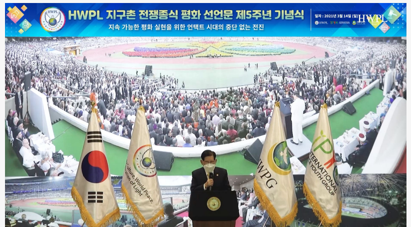
Președintele HWPL Man Hee Lee adresându-se la cea de-a cincea comemorare anuală HWPL a DPCW