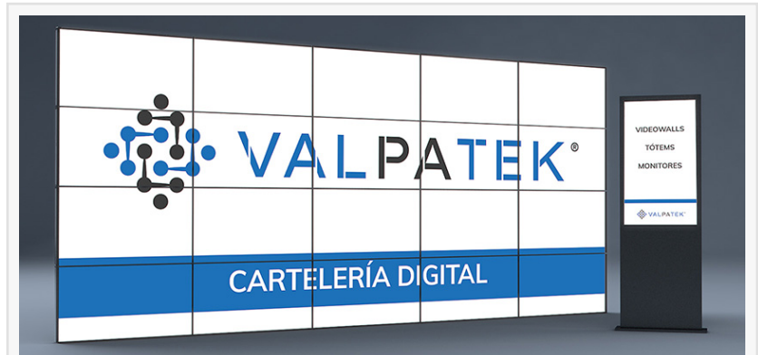
Valpatek Technology Group refuerza su presencia en proyectos de cartelería digital

La oferta de Valpatek se completa con un catálogo de servicios técnicos propios que cubren