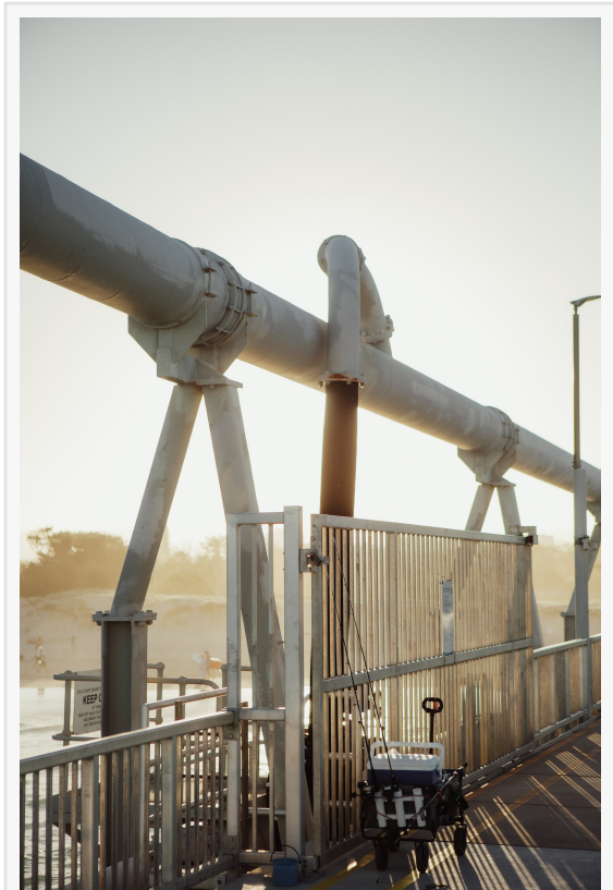
AV-Comparatives - Colonial disaster could have been prevented easily