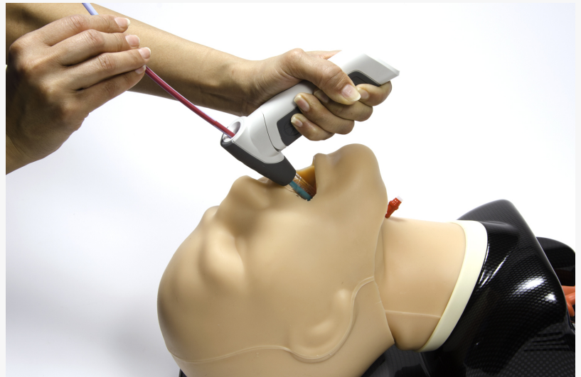
Vie Scope and Voir Bougie in use