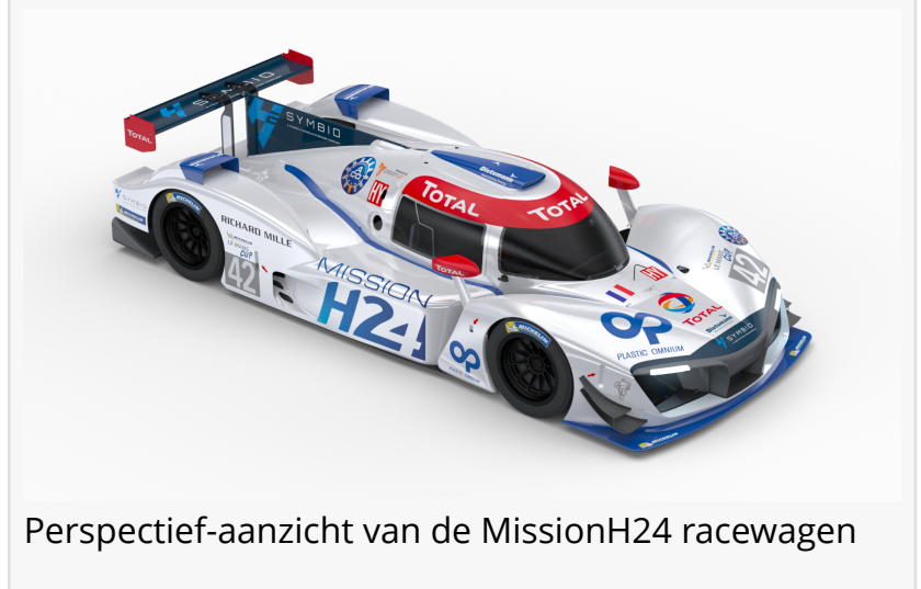
Perspectief-aanzicht van de MissionH24 racewagen

This press release can be viewed online at: https://www.einpresswire.com/article/542179573