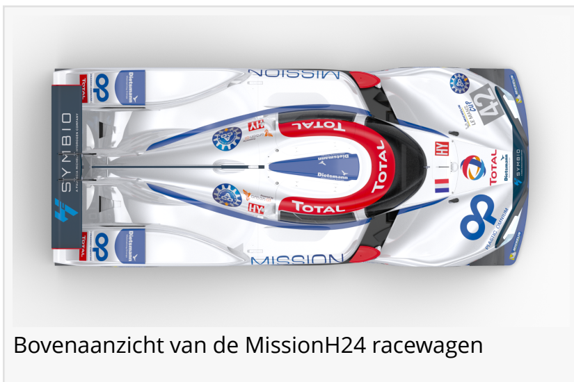
Bovenaanzicht van de MissionH24 racewagen

onderhoudsdienstverlener in de energiesector, zet verder in op duurzaamheid. Het bedrijf heeft een naam opgebouwd met zgn. 'Predictive Maintenance', het strategisch gepland onderhouden van olie-, gas- en elektriciteitscentrales om deze zo efficiënt mogelijk, en met minimale belasting van het milieu, te laten draaien. Naast duurzame onderhoudsmethoden voor conventionele energiewinning, richt Dietsmann zich ook