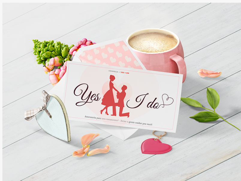
Cerimonialista de Casamentos