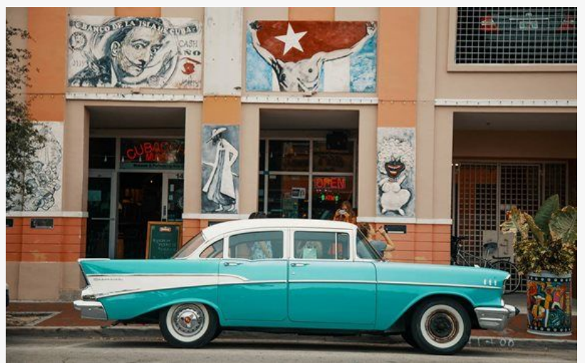
Cubaocho Art Museum

MIAMI, FLORIDA, UNITED STATES, July 30, 2021 /EINPresswire.com/ -- Cubaocho Art Museum, Inc. firma que cobija al emblemático Cubaocho Museum & Performing Arts Center , de la Calle 8, en el famoso vecindario miamense de Little Havana acaba de obtener más de medio millón de dólares de parte del programa de Subvenciones para Operadores de Locales Cerrados (SVOG, por sus siglas en inglés).