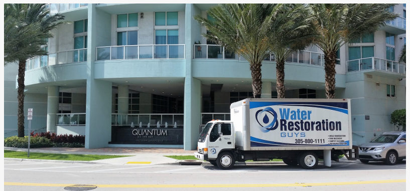
Water Restoration Guys en servicio