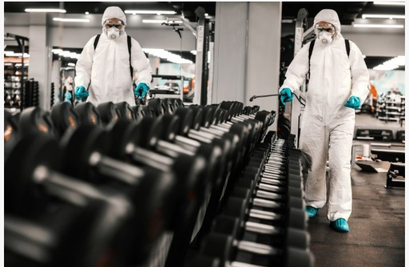
Water Restoration Guys en acción