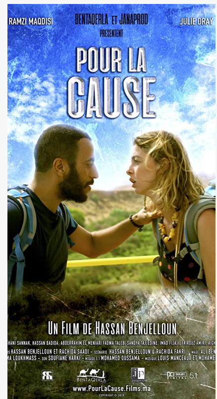
Affiche POUR LA CAUSE @ Fifda.org