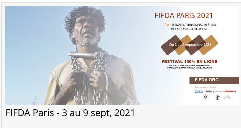
FIFDA Paris - 3 au 9 sept, 2021

PARIS, FRANCE, August 30, 2021 /EINPresswire.com/ -- FIFDA LANCE SA ONZIEME EDITION EN LIGNE DU 3 AU 9 SEPTEMBRE 2021 AVEC 11 FILMS AVEC DES HISTOIRES DE L'AFRIQUE, DE SA DIASPORA ET D'AILLEUR