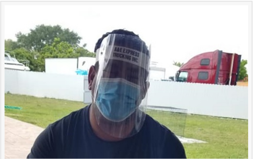
Miembro del team