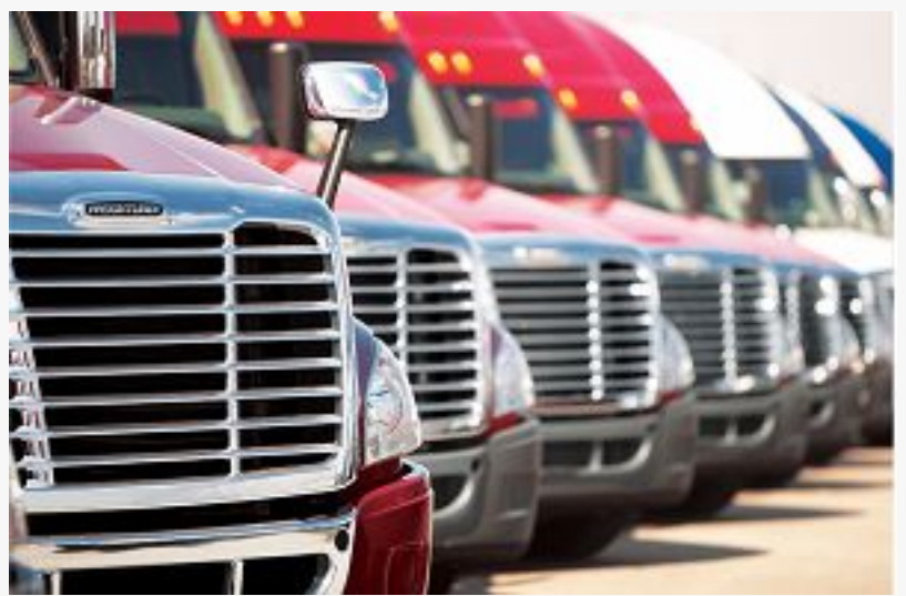
Transportación de cargas seca y refrigerada

MIAMI, FLORIDA, UNITED STATES, September 1, 2021 /EINPresswire.com/ -- A&E Express Trucking, Inc. , firma de transportación radicada en Miami, obtuvo casi medio millón de dólares de financiamiento gracias al incremento en el monto máximo del Préstamo de Desastre por Daños Económicos (EIDL, por sus siglas en inglés), otorgado por la Administración de Pequeñas Empresas (SBA, por sus siglas en inglés) a los pequeños negocios afectados por la pandemia.