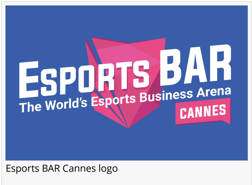
Esports BAR Cannes logo