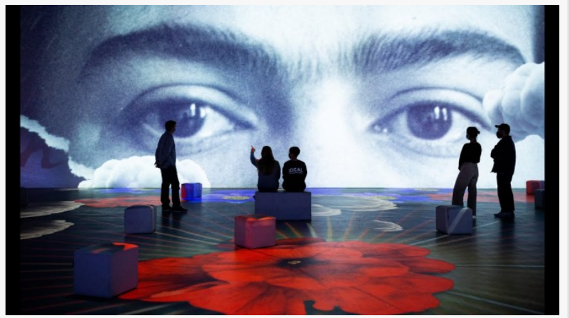
Frida Kahlo en realidad virtual Barcelona

Frida Kahlo abre de par en par las puertas de su intimidad, su historia, sus pensamientos, su entorno y los acontecimientos que desde pequeña marcó su vida hasta convertirla en un referente ineludible del siglo XX, en una combinación única de artes digitales, proyecciones de gran formato, realidad virtual y entornos expositivos clásicos.