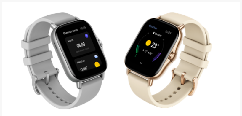
Tu socio en los entrenamientos y en el resto de actividades del día