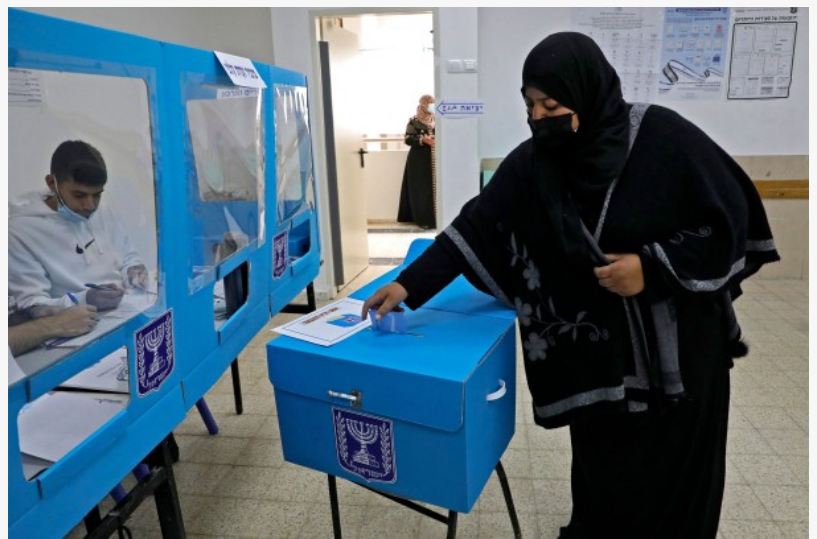
Arabisch moslim stemt in Israël

BRUSSEL, BELGIË, February 10, 2022 /EINPresswire.com/ -- In zijn jaarlijkse rapport over de toestand van democratieën in de wereld heeft The Economist Israël gerangschikt als het 23ste meest democratische land ter wereld, op een kleine afstand achter Frankrijk.