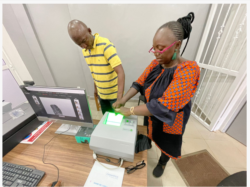
Inscription à l'ABIS en Guinée

CONAKRY, GUINÉE, February 23, 2022 /EINPresswire.com/ -- Innovatrics ABIS aide à numériser les archives papier de la police en Guinée. Depuis décembre, cette solution a permis à tous les districts de police d'identifier efficacement les auteurs d'infractions par leurs empreintes digitales, réduisant ainsi le temps nécessaire aux identifications de quelques heures à quelques secondes.