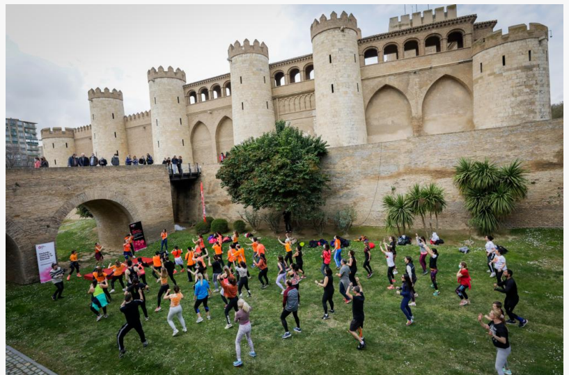
World Happiness Fest 20 de Marzo