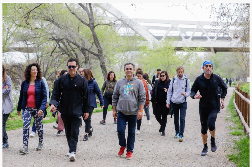
World Happiness Fest 20 de Marzo