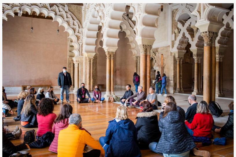
World Happiness Fest 20 de Marzo