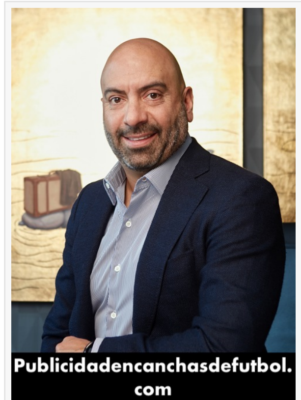
Jose Eshkenazi Publicidad en canchas de futbol

Hoy en día, las marcas buscan ofrecer recompensas y valor agregado para enriquecer la experiencia del consumidor y garantizar recurrencia; con TREBEL, tu marca puede ofrecer un servicio de música para maximizar lealtad y construir relaciones digitales que maximicen la