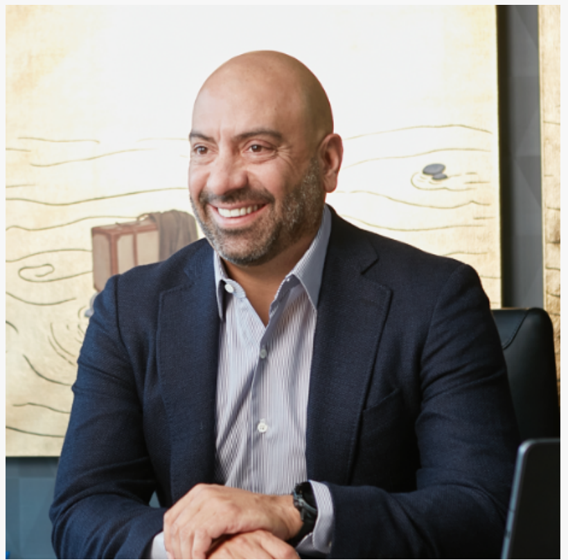
Jose Eshkenazi Soccer Media Solutions