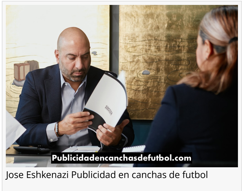
Jose Eshkenazi Publicidad en canchas de futbol

Nuestro equipo estará próximamente en contacto con ustedes para presentarles este producto que está rompiendo todos los paradigmas en la forma como escuchamos música y en la manera como ayudamos a las marcas a generar conexiones con sus clientes a través del passion point de la música. □