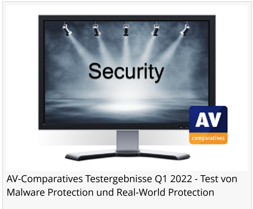
AV-Comparatives Testergebnisse Q1 2022 - Test von Malware Protection und Real-World Protection

INNSBRUCK, TIROL, ÖSTERREICH, April 15, 2022 /EINPresswire.com/ -- AV-Comparatives , ein Anbieter unabhängiger Vergleichstests und Bewertungen von Antivirus-Produkten, hat die aktuellen Security-Software-Evaluierungsergebnisse seines Malware Protection Tests für den Monat März und das Factsheet für den Real-World Protection Test für die Monate Februar-März veröffentlicht.