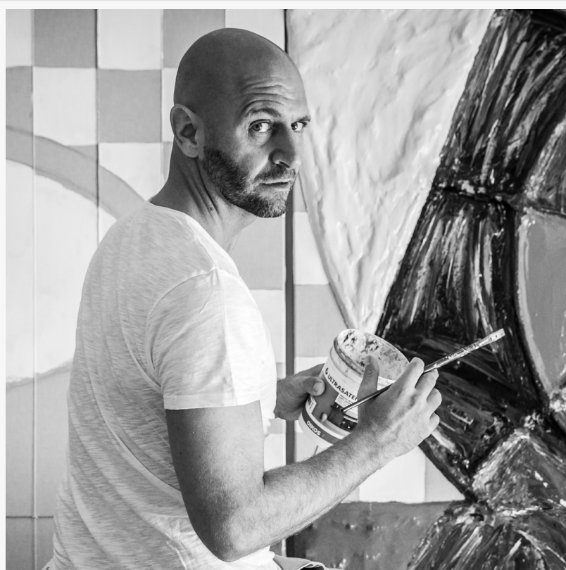
L'Artista Cesare Catania apre la sua galleria personale nel Metaverso di Spatial