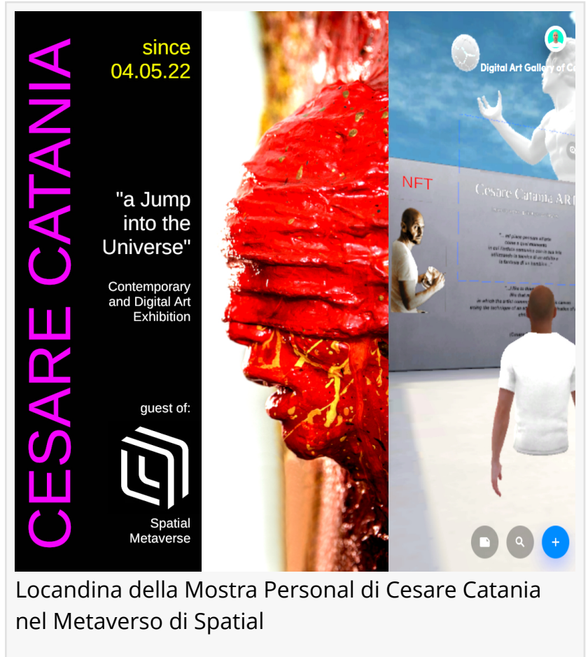
Locandina della Mostra Personal di Cesare Catania nel Metaverso di Spatial

Con la possibilità di costruire il proprio avatar, il visitatore accederà alla personale di Cesare Catania e potrà sperimentare la sua arte, che fonde insieme tradizione, innovazione e tecnologia. L’artista infatti è capace di mantenere la propria riconoscibilità attraverso le diverse tecniche impiegate, una ricerca costantemente attenta ai più recenti linguaggi della contemporaneità. “Un Salto nell’Universo” verrà presentata alla stampa giovedì 21 aprile 2022, dalle ore 11 alle 15,