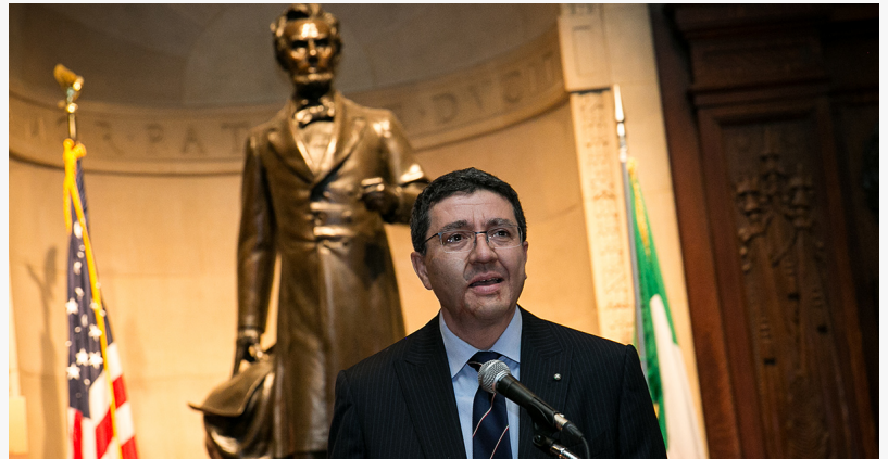
Diplomat and author, Andrea Canepari

Nel corso di una lunga e illustre carriera, Andrea Canepari è stato Ambasciatore d'Italia nella Repubblica Dominicana e Console Generale a Philadelphia. In entrambi i ruoli, ha sempre promosso iniziative diplomatiche per favorire la collaborazione tra l'Italia e il resto del mondo. È inoltre coeditore di