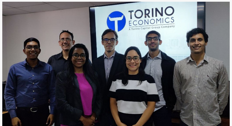
Equipo de Torino Economics