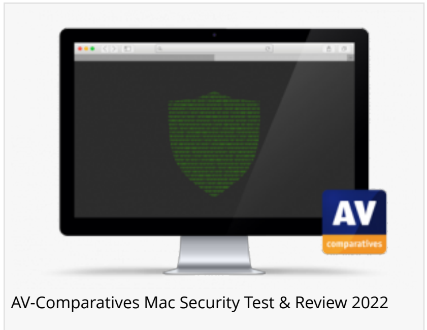
AV-Comparatives Mac Security Test & Review 2022

INNSBRUCK, TIROL, ÖSTERREICH, June 28, 2022 /EINPresswire.com/ -- AV-Comparatives hat zehn Security-Lösungen auf Apples macOS Monterey geprüft und getestet. Lesen Sie den Mac Security Test & Review 2022 , um zu erfahren, welche Security-Lösungen zertifiziert wurden. https://www.av-comparatives.org/tests/mac-security-test-review-2022/