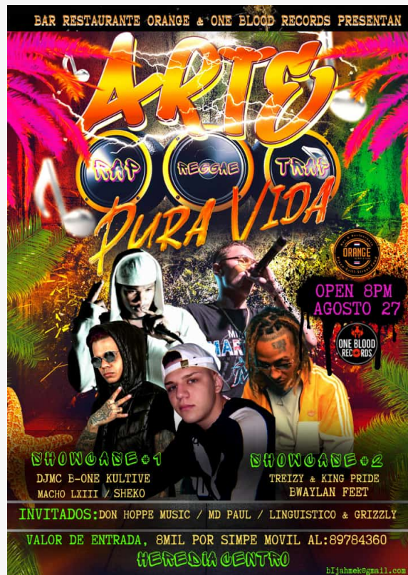
El equipo también filmará en el One Blood Records Festival el 27 de agosto.