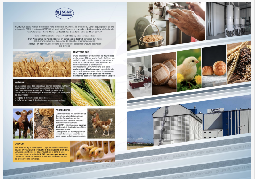
SGMP Corporate Brochure Inside Panels

Established in 2018 and headquartered in Kinshasa, Congo, Bio Agro-Business specializes in agro-industrial exploitation, the supervision of producers in rural areas, and technical, entrepreneurial agricultural training.