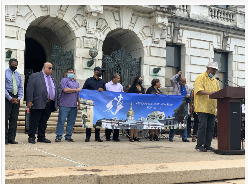
Trenton NJ City Hall