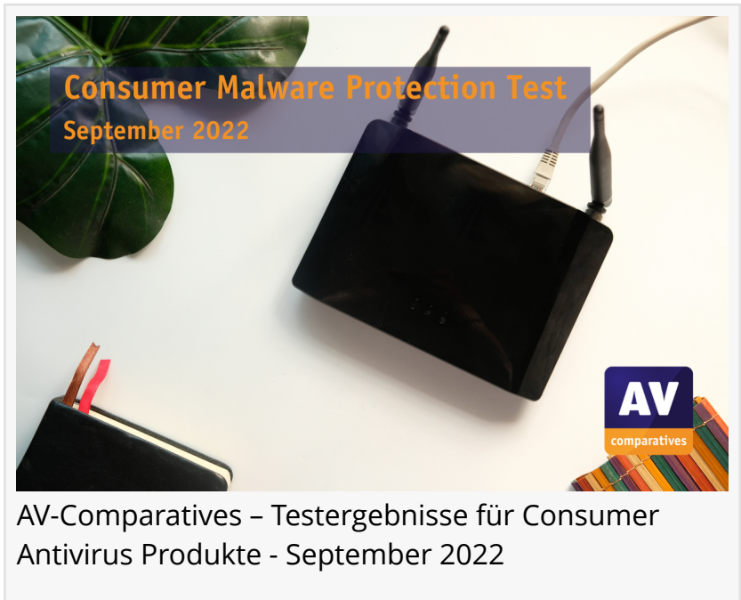
AV-Comparatives – Testergebnisse für Consumer Antivirus Produkte - September 2022

INNSBRUCK, TIROL, ÖSTERREICH, October 17, 2022 /EINPresswire.com/ -- Im Rahmen der laufenden Consumer Main-Test Series hat AV-Comparatives die Ergebnisse seines Malware Protection Tests für Consumer Security-Antivirus Lösungen vom September 2022 veröffentlicht. 17 bekannte Anti-Malware-Programme wurden auf ihre Fähigkeit geprüft, schädliche Dateien vor, während oder nach der Ausführung zu erkennen und zu blockieren.