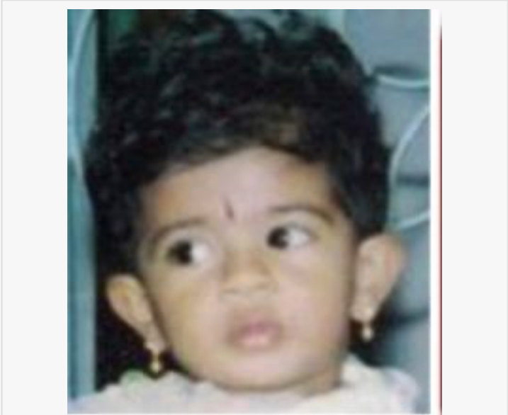
3 years old when Disappeared

00000000 000000000000 0000 000000000000000000 000000000 14 00000 00000000000. 000000000000 00000 00000000000 000000000 0000000000 0000 0000000 0000000000000000000000000000000000000000 00000000000000000000 0000000000000000000000000000000000.