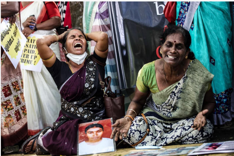
Tamil Mothers Seeking their Disappeared Babies Protest Outside UN in Colombo

சிங்கள அரசின் பின்னர் மரண தண்டனை வழங்கப்பட்டது, ஆனால் சிங்கள அரசின் பின்னர் மரண தண்டனை வழங்கப்பட்டது. சிங்கள அரசின் பின்னர் மரண தண்டனை வழங்கப்பட்டது, ஆனால் சிங்கள அரசின் பின்னர் மரண தண்டனை வழங்கப்பட்டது. சிங்கள அரசின் பின்னர் மரண தண்டனை வழங்கப்பட்டது, ஆனால் சிங்கள அரசின் பின்னர் மரண தண்டனை வழங்கப்பட்டது. சிங்கள அரசின் பின்னர் மரண தண்டனை வழங்கப்பட்டது, ஆனால் சிங்கள அரசின் பின்னர் மரண தண்டனை வழங்கப்பட்டது. சிங்கள அரசின் பின்னர் மரண தண்டனை வழங்கப்பட்டது, ஆனால் சிங்கள அரசின் பின்னர் மரண தண்டனை வழங்கப்பட்டது.