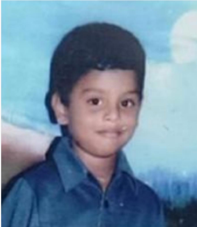
10 years old when Disappeared