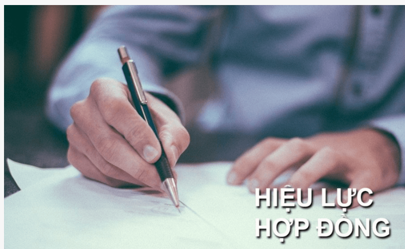
Giá tiền sang tên sổ đỏ trọn gói đất lâm nghiệp Quận Ba Đình