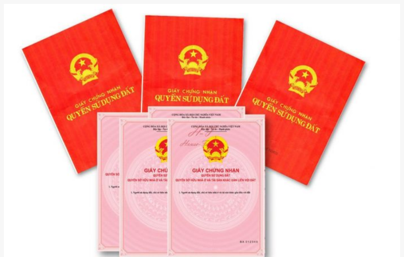
Công chứng sang tên sổ đỏ trọn gói cho con thừa kế Quận Đống Đa