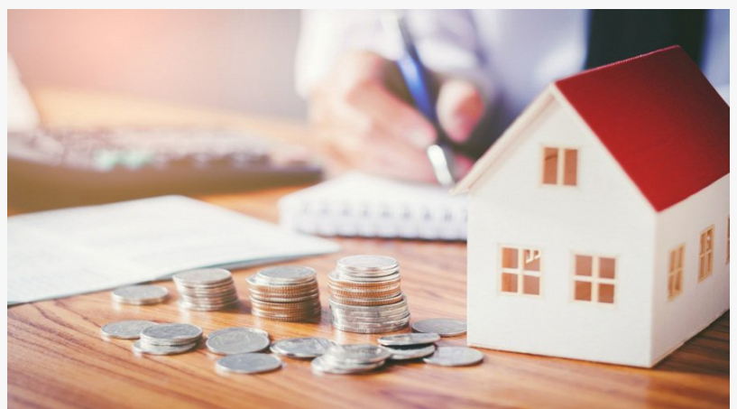
Dịch vụ sang tên sổ đỏ trọn gói đất nông nghiệp Quận Đống Đa